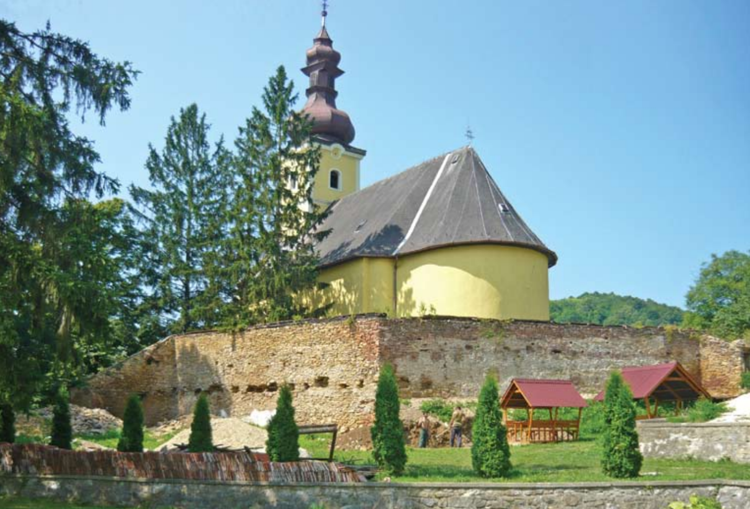
Bódvaszilasi templom kelet felől