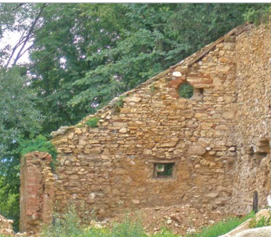
A délkeleti, támpilléerként funkcionáló barokk kori oromfal, amelynek alsó ablaka egykor lőrés lehetett (a szerző felvétele)

ezen a részen, az az észak felől eső magasabb falrész és a templom déli ívét átölelő alacsonyabb fal csatlakozása. Az alacsonyabb falsík egyszer enyhén megtörik, mielőtt csatlakozna az álló oromfalhoz. Ezt a pontot tekinthetjük az egykori védmű egyik belső sarkának, míg a feltételezett nyílás másik oldalát a magasan álló fal sarka adja (ott, ahol derékszögben keletnek fordul a rendszer, s a barokk kori oromfal maradványaként folytatódik). A két pont közötti távolság 3 méter, ami pontosan megegyezik az északi védmű belső sarkainak távolságával. Ezen felül még az sem elképzelhetetlen, hogy a barokk kori épületeket dél felé lezáró oromfal alsó ablakát egy lőrésből alakították ki, azaz a kora újkori védmű északi oldalát felhasználták a barokk kori építkezéseknél.