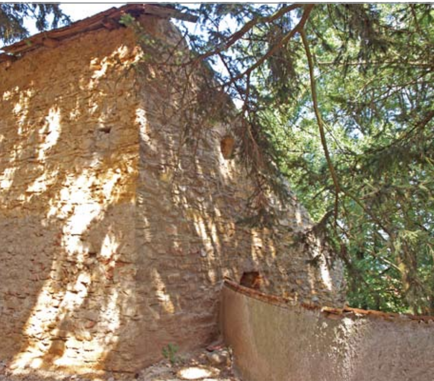
A körítőfal csatlakozása a délkeleti sarkon, amely egykor a délkeleti védmű bejárata lehetett

emelt első erődítés még a "régi" templomot vette körbe. Északi védművén kívül további legalább egy, de lehet, hogy kettő ugyanilyen eleme volt a körítőfalnak. Az északit követő négyzetes erődítés a délkeleti részen lehetett (az északi elemtől számított második szögénél). Feltételezésünket igazolhatja az, hogy a meredek lejtőn egy négyzetesen körberajzolható plató van, amelynek helyzete és mérete pontosan kiadja egy négyzetes erődítmény vonalát. Az is támogatja az elképzelést, hogy a kis területen rengeteg a kőomladék. De ami a leginkább feltűnő