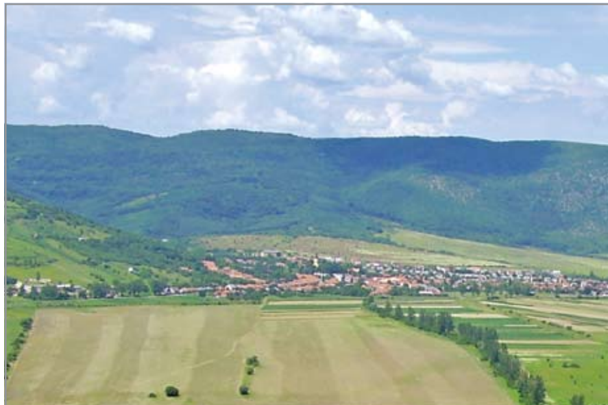
Bódvaszilás látképe délkelet felől