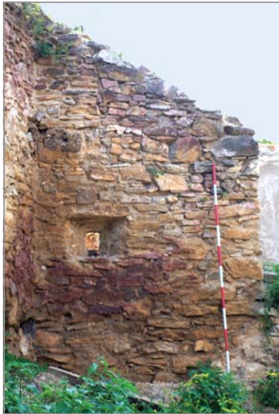
Lőrés az északi védmű külső, keleti oldalán

A fal keleti és északi szakaszán végzett régészeti kutatások több tekintetben árnyalták és bővítették eddigi ismereteinket. Az északi területen, a négyzetes védműtől nyugatra, a felszín alatt került elő a védműhöz közvetlenül kapcsolódó eredeti, egy periódusú falrész maradványa. Innen és a bástya belsejében nyitott árkokból kora újkori leletanyag került elő, rétegtanilag azonban csak az előbbi terület az értékelhető.