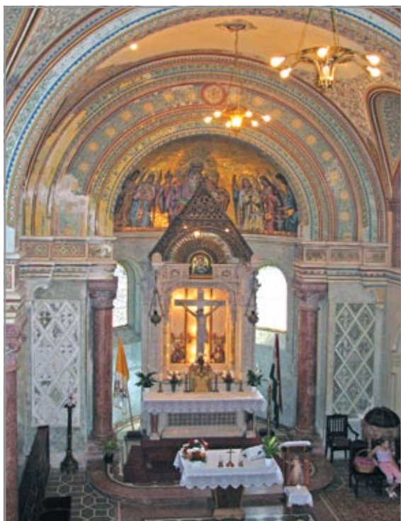
A kápolna belső tere és oltára

Az épületek terveinek elkészítését egy osztrák építészre, az „architekt in k. k. Baurath” Viktor Siedekre bízta. A bécsi építész munkássága kiterjedt az egész Osztrák-Magyar Monarchia területére. Hozzávetőleg tíz esetben magyar területen, a magyar főúri réteg számára dolgozott. Munkái között főleg kastélyokat, villákat, palotákat találunk, de számos középületet is tervezett. A dobozi templom, mint épülettípus azonban ritkaság Siedek épületei között. Az építész munkáira a stílusok sokfélesége jellemző, hiszen a korabeli építési-tervezési gyakorlat megkövetelte a művésztől, hogy otthonosan mozogjon a különböző történeti stíluskorszakokban. Az együttes tervezésekor az építész a romanika stílusjegyeit választotta.