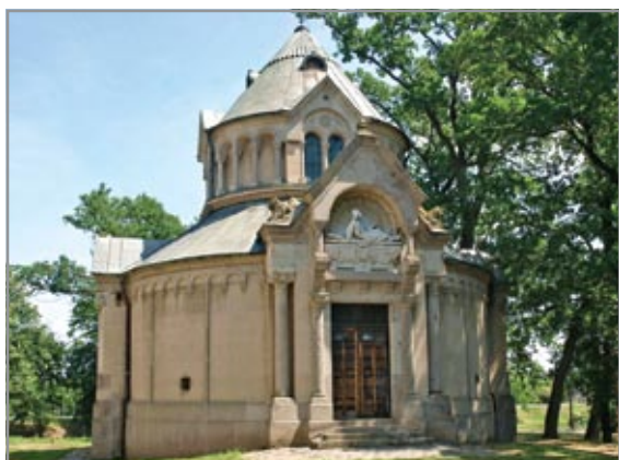
A Wenckheim család dobozi sírboltja