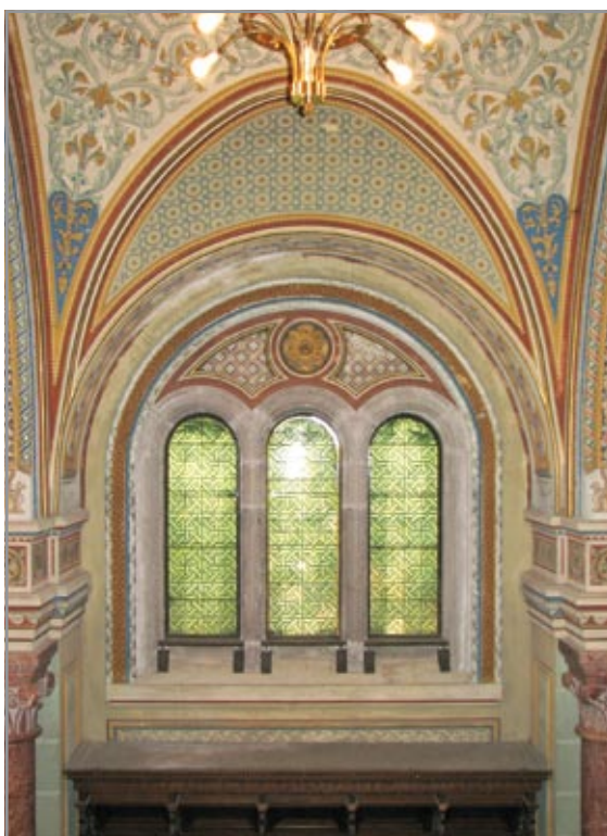
A kápolna díszítőfestése a karzaton