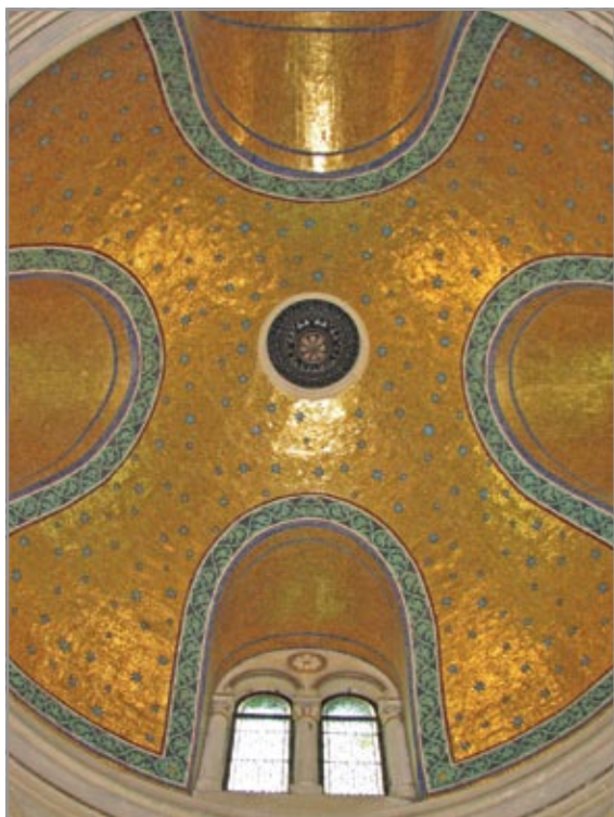
A kripta kupolájának mozaikja