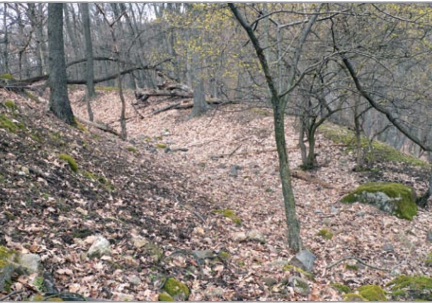
A vár északkeleti oldalán húzóódó árok