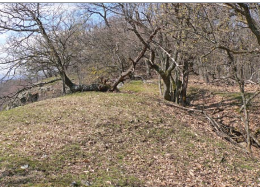
A vár belterülete dél felől

a várat – talán ezek azok a történeti adatok, amelyek e hipotézis szerint Nagykő várához kapcsolhatók.