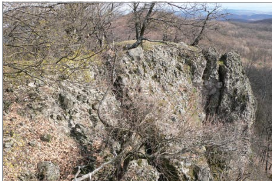
A várat a délnyugati oldal felől határoló sziklás szakadék

Engel Pál: Magyarország világi archontológiája 1301–1457. Budapest, 1996. I. 271. II. 8.