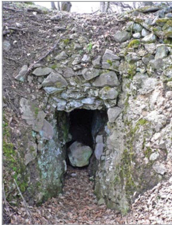
A kerítőfal csekély maradványa a hegytető keleti oldalában

A Nagybalog mellett északkeletre magasodó Örhegy (Železná) a nevéből feltételezhetően, illetve a helyi monda alapján a török időkben megfigyelőhely lehetett. Legmagasabb pontján esetleg fatorony állhatott, amelyből a helybéliek szerint a Balogvölgyet kémlelték. E hegy első írásos említése „Nagy eörhegy” formában 1618-ból ismert. A hegytetőn azonban jelenleg még a lombtalan időszakban sem figyelhetők meg épület nyomai. A hegy legmagasabb pontján lévő, patkó alakú sekély árkot valószínűleg a II. világháború idején, hadászati célból ásták ki. Az ekkor kiforgatott és oldalra dobott földet megvizsgáltuk, de az állítólagos toronnyal kapcsolatba hozható korhatáro-