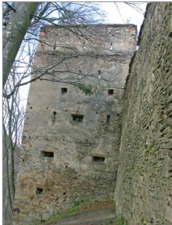
A Fejedelemtorony délről