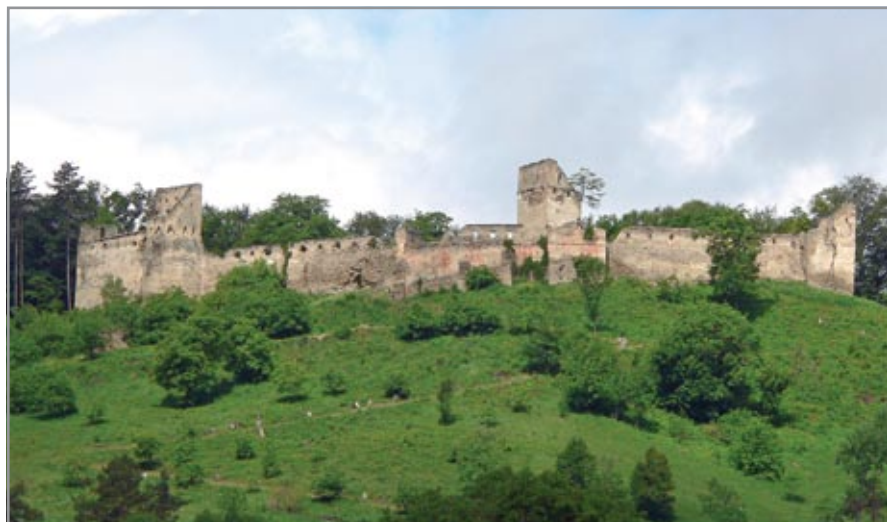
A vár távlati képe keletről