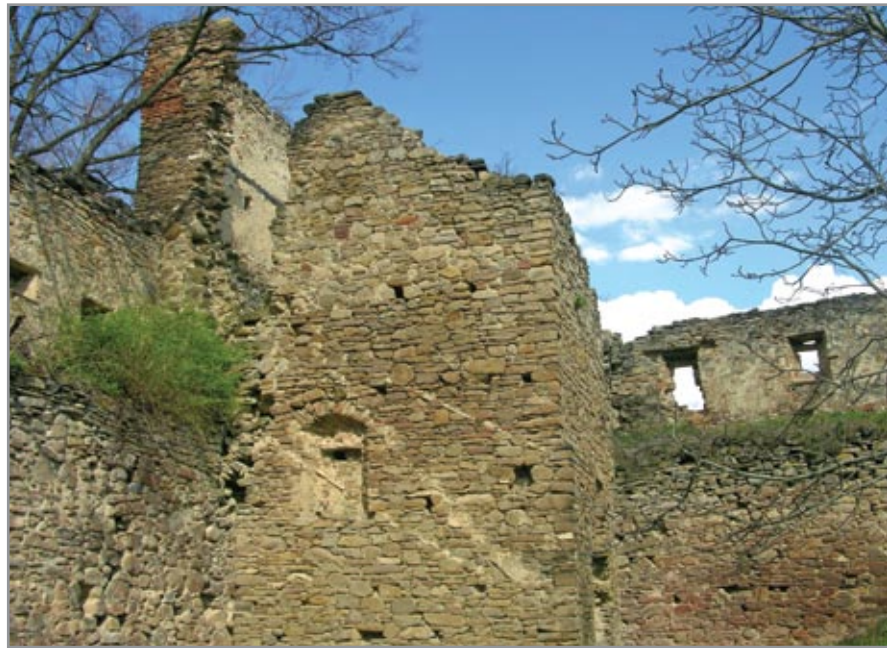
A Pap-torony a várbelső felől nézve

Marcu Istrate, Daniela: Saschiz . București. 2012.