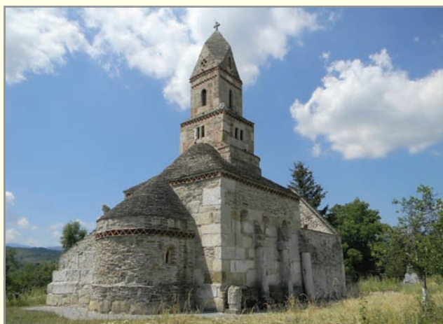
A „Demsus” c. fotót (felül) Szabolcsi Erzsébet készítette. A „Somoskő” c. képpel (alul) Stibor Norbert első lett az internetes szavazáson.